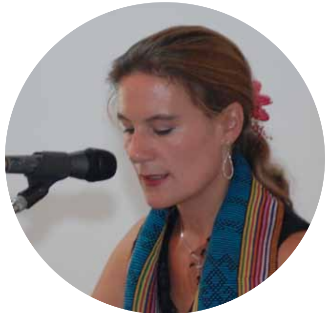
Kirsty Sword Gusmão

Ho apoiu konstante no amizade hosi ami nia parseiru no doador sira, tuan no foun, ami sei kontinua hodi hamriik metin iha defeza ba ami-nia mandatu hodi kontribui ba moris ne`ebé ho dignidade, prosperiedade no independénsia loloos ba fetu no labarik sira iha ita-nia nasaun foun.