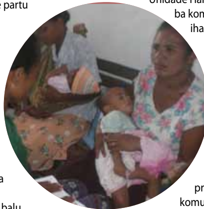
PHOTO: MSG FO KONSELU IHA CENTRU SAUDE KOMMUNIDADE NIAN

Estudu ne'e mós sei ezamina fatór protetivu ne'ebe rekunese no eziste hela, no ninia rezultadu sei uza atu influénsia polítika saúde no sosiál ne'ebe relevante no dezeńu intervensaun ne'ebe propriu.