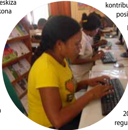
PHOTO: TREINAMENTU KOMPUTADOR BAZIKU BA FETO FOIN SA'E SIRA

Projeitu seluk, implementa ona iha parseria ho Marie Stopes International (MSI), ho meta atuhase asesu ba feto, mane no foinsa'e iha otas reproduktiv atu informa kona-ba Saúde Reprodutivu Sexual (SRS). Projeitu ne'e nia titulu mak Alkansa – Haluan alkansamentu komprensivu kona saúde seksual no reproduktiv ba comunidade vulnerável sira iha rural Timor-Leste. Projeitu ne'e implementa tiha ona iha distritu haat: Baucau, Maliana, Ermera no Atauro. Número total mak alkansa liuhosi projeitu ne'e hosi fulan-Juñu to'o Dezembru 2009 besik 845.