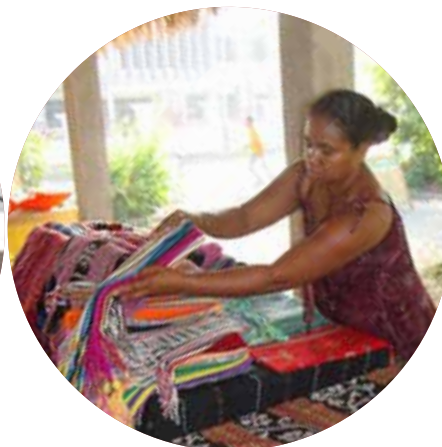
PHOTO: SORU TAIS NAIN SIRA PREPARA AA'N BA ALOLA NIA ANNUAL FEIRA NATAL