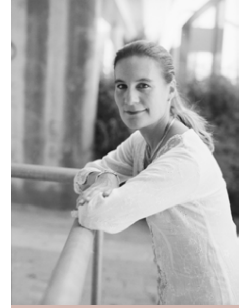
Kirsty Sword Gusmão Maiu 2011

FETO FORTE, NASAUN FORTE STRONG WOMEN, STRONG NATION